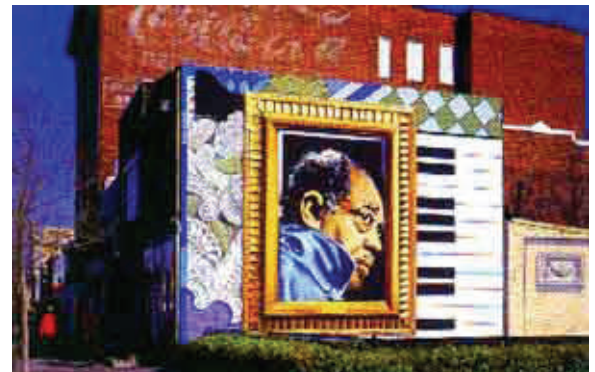
Pictured right: La imagen a la derecha indica la transformación de un muro en las calles 13 con U, N.W., antes plagado con graffiti, ahora un bello mural .